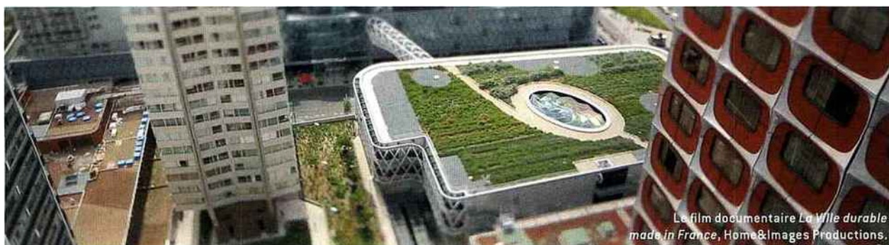
Le film documentaire La Ville durable made in France , Home&Images Productions.

APRÈS-MIDI | C'EST MERCREDI VERT ! Je vaque d'une étape à l'autre du « parcours végétal », en prenant le temps de me poser la question soulevée : comment la flore embellit-elle notre expérience d'un lieu ? D'installations en événements, je suis toujours plus convaincue que la verdure fait du bien ! Et la projection du film documentaire La Ville durable made in France me le confirme.