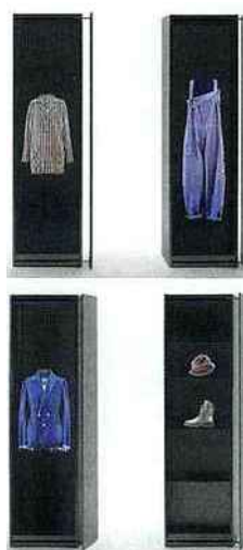
Mobilier dessiné par Jean Nouvel pour la boutique du créateur japonais Yoji Yamamoto.