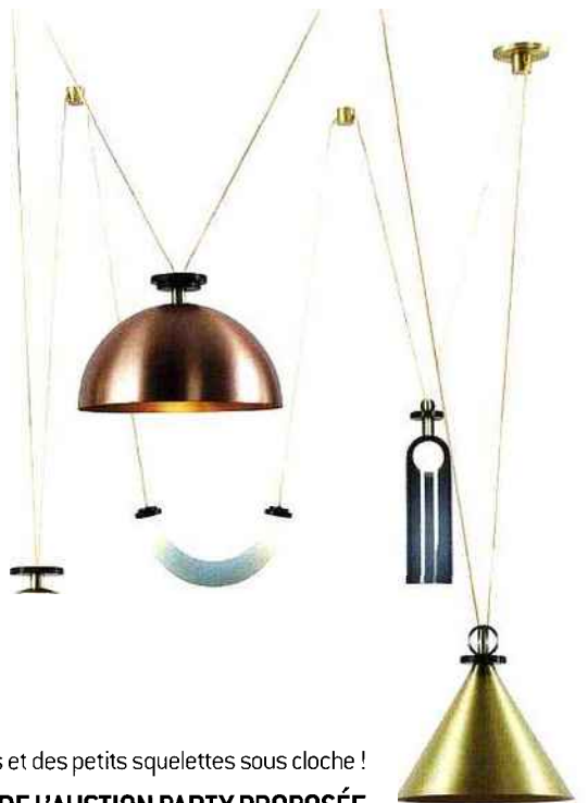
Ladies & Gentlemen Studio, chandelier Shape Up.

20H00 | JE BLOQUE MA SOIRÉE POUR NE PAS PERDRE UNE MIETTE DE L'AUCTION PARTY PROPOSÉE PAR MOUSTACHE. Une fête d'enchères où cette maison d'édition se permet quelques digressions dans un territoire « d'expérimentations habituellement interdites ». Je piaffe ! Heureusement, l'exposition elle-même « Moustache rencontre Favoris » commence le 3 septembre (et s'achève le 6).