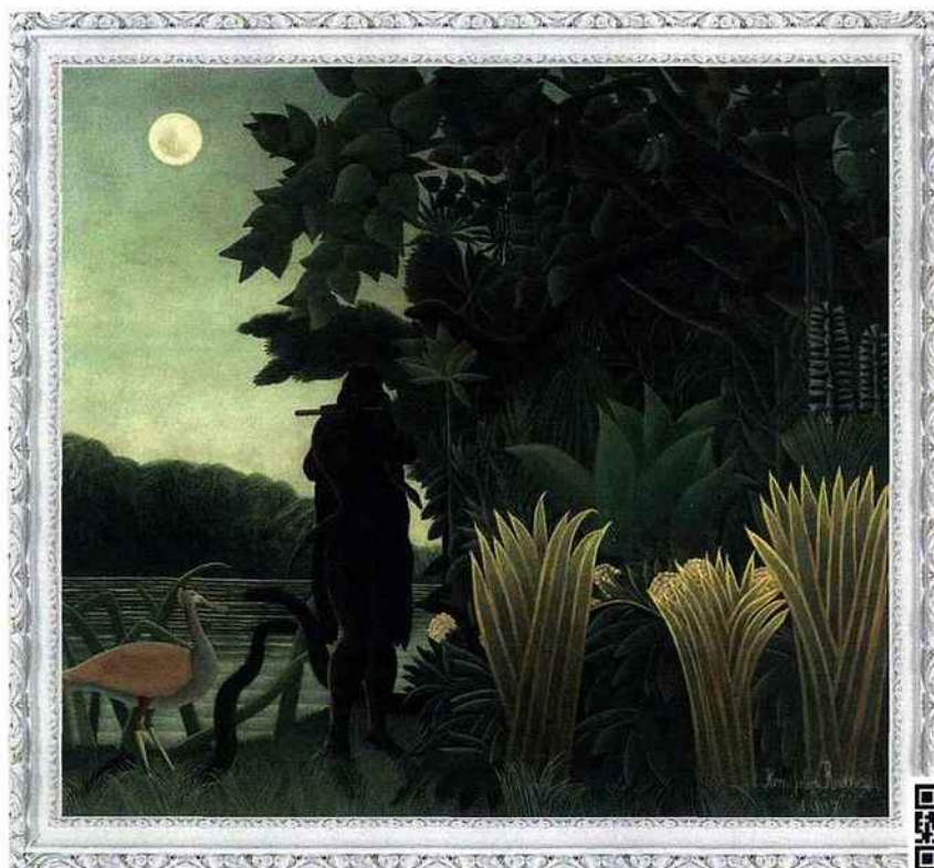
LA CHARMEUSE DE SERPENTS, LE DOUANIER ROUSSEAU

Les études d'animaux de ce peintre flamand (1622-1674) sont remarquables, tant l'artiste a peint les animaux sur le vif, saisissant leurs traits (reproduits de divers points de vue) avec le soin du naturaliste, et leurs attitudes. Cette toile est conservée au musée du Louvre. Papier fine art, à partir de 32,44 €.