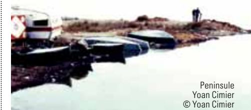
Peninsule Yoan Cimier

Completely hand made in their Parisian studio, a Muséo edition is "Made in France", "Handmade" and "tailor-made" three labels becoming rare! To certify the quality and uniqueness of every piece, an "ARTrust" seal is affixed to the back of each work.