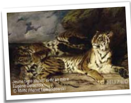
Jeune tigre jouant avec sa mère Eugène Delacroix