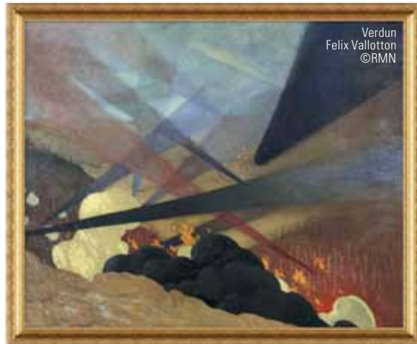
Verdun Felix Vallotton ©RMN