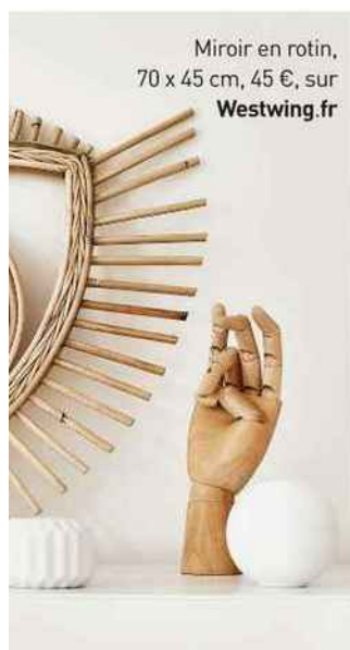
Miroir en rotin, 70 x 45 cm, 45 €, sur Westwing.fr